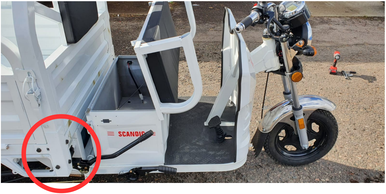
14.Kiinnitä selkänöja 10mm pulteilla ja muttereilla.