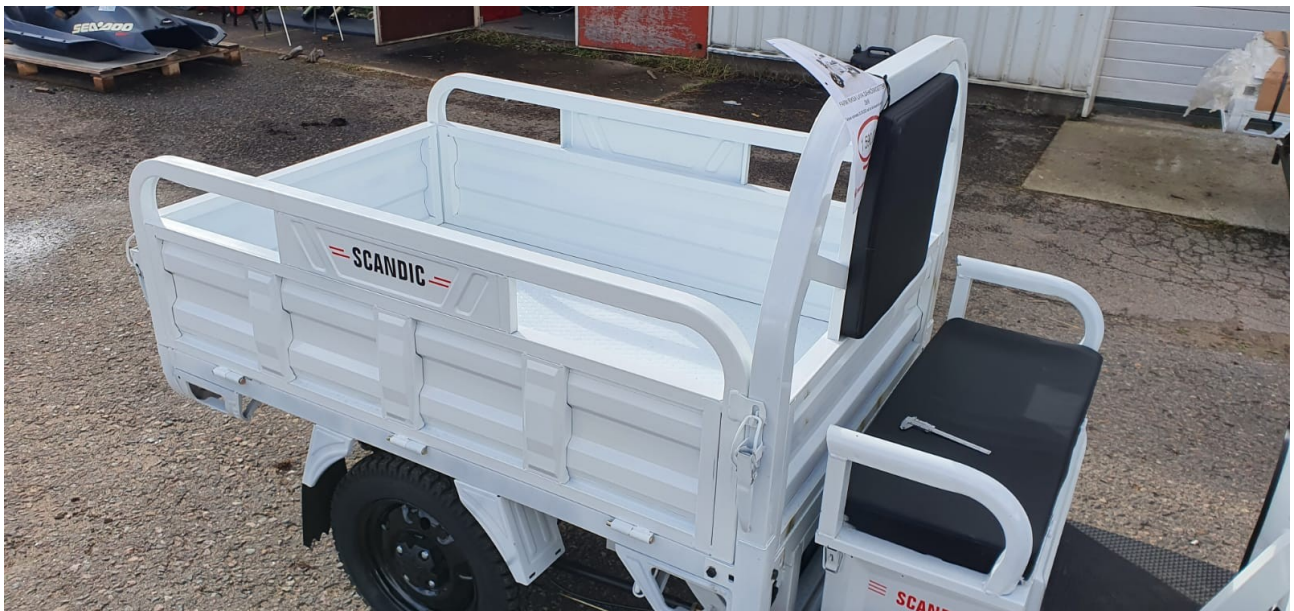
15.Kiinnitä lavan laidat käyttäen lukitustappeja.